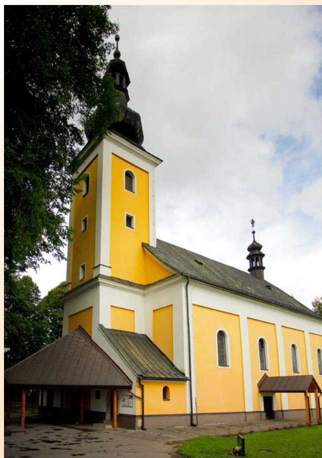
Kościół św. Bartłomieja – Czadca

După cum afirmă Eugeniusz Kłosek, există motive întemeiate să se presupună că printre muntenii din Czadca nu a fost înrădăcinată la acel moment o conștiință națională poloneză, în schimb lucrurile stau altfel în privința conștiinței religioase