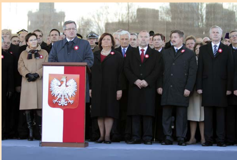
Przemówienie Prezydenta Bronisława Komorowskiego na Placu Piłsudskiego

złożyli wieńce przed pomnikiem Wincentego Witosa, przywódcy ruchu ludowego, trzykrotnego premiera II RP. Uczestnicy marszu „Razem dla Niepodległej” odśpiewali „Rotę”.