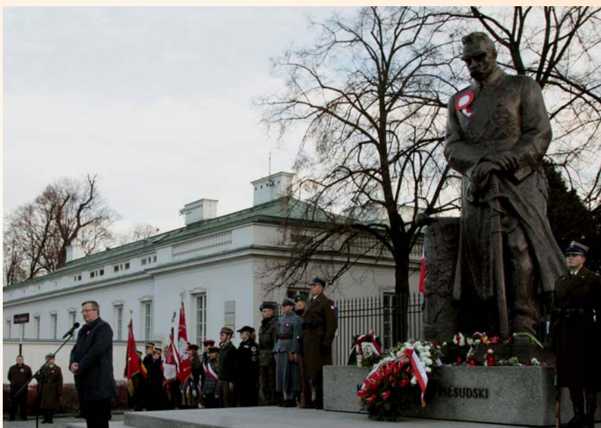
Przemówienie Prezydenta RP przed pomnikiem Marszałka Józefa Piłsudskiego

Apoi președintele a depus flori la monumentul lui Ignacy Jan Paderewski. Acolo au depus coroane și premierii celei de a III-a Republici. În fața acestui monument s-a cântat „Cântecul cavaleresc”.