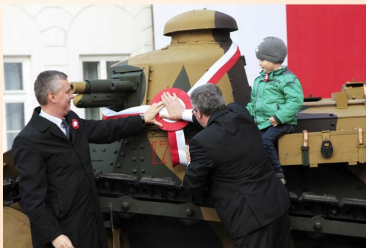
Prezydent RP wraz z ministrem ON Tomaszem Siemoniakiem dekorują świąteczną kokardą zabytkowy czołg Renault FT17