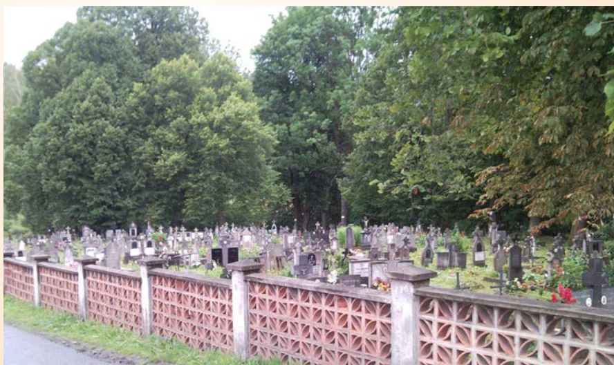
Stary cmentarz – Skalite

Religiozitatea acestor munteni s-a dezvoltat în mod categoric sub influența evenimentelor istorice și, fiind o zonă de frontieră, acest teritoriu era caracterizat nu numai prin variația teritorială, politico-statală, etnică, culturală și lingvistică, ci mai ales din punct de vedere confesional. În această perioadă, în zona Czadca, ajungea cu siguranță influența protestantismului, care era în dezvoltare, mai ales în varianta evanghelică, dovadă fiind numeroasele biserici existente până în prezent. Prin urmare, putem deduce că lipsa altor confesiuni printre grupul de imigranți polonezi în Bucovina, fiindcă evanghelicii erau doar cetățenii de etnie germană, este o dovadă clară că ideea națională în rândul imigranților polonezi, dacă nu era constituită, cu siguranță avea deja rădăcini adânci. Ar trebui să adăugăm că absența totală a unor instituții