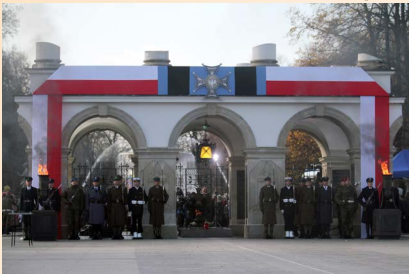
Grób Nieznanego Żołnierza

Uroczystości przed Grobem Nieznanego Żołnierza i marsz „Razem Dla Niepodległej” były w Warszawie głównymi akcentami obchodów Święta