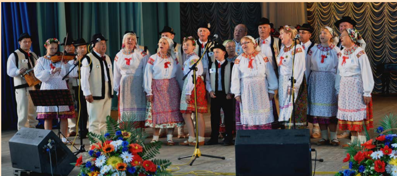
„Jodelki” podczas „Bukowińskich Spotkań” w Czerniowcach w 2013 r.

trowiu drugą najważniejszą imprezą, gdzie w Polsce spotykają się Bukowińczycy. Także w 2006 r. zespół odniósł swój pierwszy prestiżowy sukces, zwyciężając w swojej kategorii w VIII Ogólnopolskim Festiwalu Polszczyzny i Pieśni Kresowej „Wielkie Bałakanie” w Żarach.