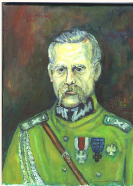
Marszałek Józef Piłsudski

niepodległości ojczyzny. Walka o wolność Polaków z zaborów rosyjskiego, austriackiego i pruskiego odbiła się szerokim echem także na Bukowinie. Wielu Polaków z Dunawca, Dawiden, Łukawca, Nowego Szołca, Pleszy, Pojany Mikuli, Starej Huty, Terebleczy, Czerniowiec czy Storjożyńca zaciągnęło się do II Brygady, zwanej Karpacką, która walczyła po stronie państw centralnych (Autro-Węgry i Niemcy) przeciwko Rosji. Także w 1914 r. przyszły Marszałek Polski stworzył Polską Organizację Wojskową,