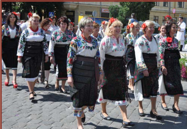
Zespół „Czerniwczanka” - Czerniowce - Ukraina