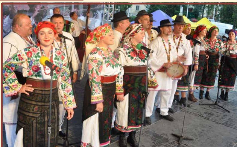
Zespół „Oberih” - Zastawna - Ukraina

Wróciliśmy do swych domów, przywożąc ze sobą kolejne doświadczenia, ale przede wszystkim miłe i niezapomniane wspomnienia. Chwile spędzone w Pojanie Mikuli i na kolejnym festiwalu „Bukowińskie Spotkania” zostaną zapisane na długo w sercach każdego z nas!