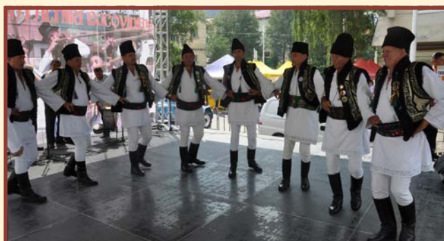
Zespół „Trilisești” - Iaslovăț - Rumunia

Stał się on możliwością do odwiedzenia grobów swoich przodków, spotkania się z rodzinami oraz nawiązania nowych znajomości, które bardzo często przerażają się w długotrwałe przyjaźnie. Gościnność, dobroć i przychylność mieszkańców Pojany Mikuli znana jest nie od dziś. Już pierwszego dnia, w niedzielę 14 lipca, ksiądz proboszcz dla przybyłych Polaków odprawił dodatkową mszę św. w kościele bł. Jana Pawła II. Po mszy była okazja do powitań, rozmów i wspólnych zdjęć z księdzem i pojańskimi rodzinami. W drugim dniu pobytu w Rumunii cała grupa z Polski wraz z młodzieżą z Pojany Mikuli wyruszyła na wycieczkę krajoznawczą do Pleszy i Nowego Sołońca, polskich wsi na Bukowinie rumuńskiej, oraz Majdanu – wioski ukraińskiej. Pobyt w Pojanie Mikuli przebiegał w ciepłej, rodzinnej atmosferze, przy pięknej, słonecznej po-