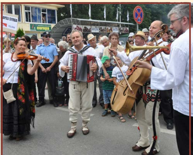
Kapela „Syrba” - Wichów - Polska