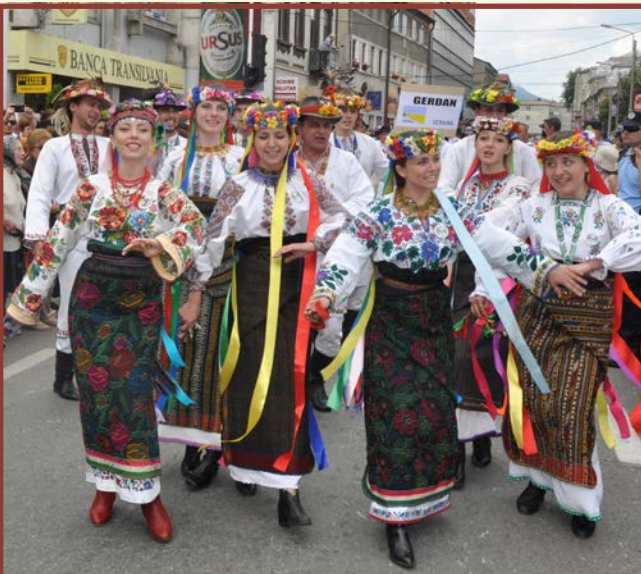
Zespół „Gerdan” - Czerniowce - Ukraina