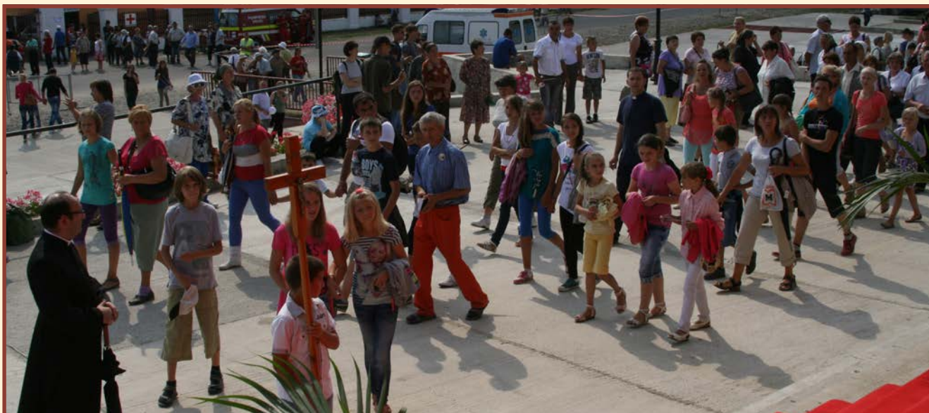
Pielgrzymka Polaków z Nowego Sokoła

W dniach 14 i 15 sierpnia, podczas obchodów święta Wniebowzięcia Najświętszej Maryi Panny, Kaczyka staje się centrum duchowym i modlitewnym. Dowodem na powszechność kultu maryjnego jest obecność ponad 5 tys. wiernych z całej Rumunii oraz z zagranicy: Polski, Niemiec, Węgier, Austrii, Włoch. Serca pielgrzymów biją jednakowo, wszyscy przybywają pełni nadziei, aby pokłonić się i pomodlić przez Matkę Chrystusa i są „wzorem dla wszystkich poszukujących Boga” – jak napisał w Liście Apos-