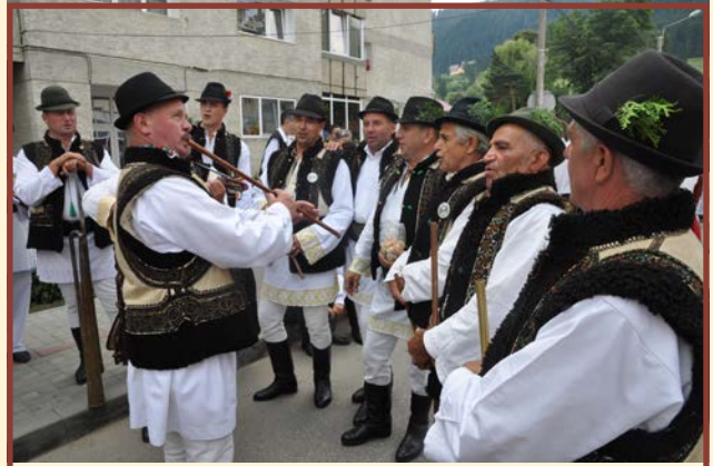
Zespół „Floare de Mălin” - Mălini - Rumunia