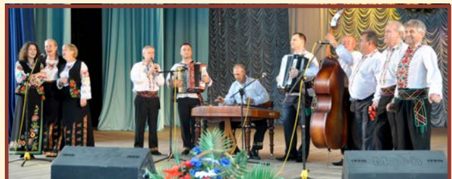
Zespół „Dzereło” - Czerniowce - Ukraina