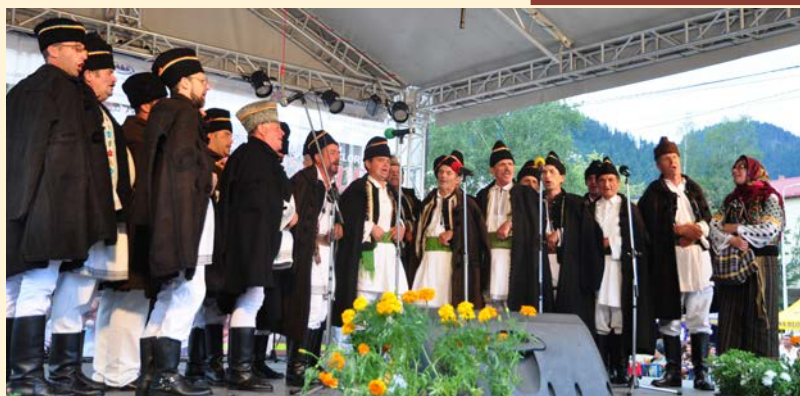
Zespół „Flori de Măr” - Râșca - Rumunia