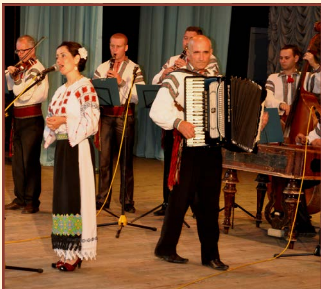
Zespół „Plaiul Herței” - Herța - Ukraina

Zespół Górali Czadeckich „Jodelki” przedstawił pieśni i tańce folkloru góralskiego, które wspa-