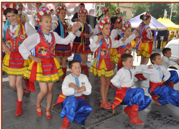
Zespół „Kozaciok” - Bălcăuți - Rumunia

locuitorilor satului Poiana le știm nu de astăzi. Încă din prima zi, duminică – 14 iulie parohul a oficiat o liturghie pentru polonezii sosiți, în biserica cu hramul Fericitul Ioan Paul al II-lea. După liturghie a fost ocazie de a ne saluta, a discuta și a ne fotografia cu preotul și familiile din Poiana. A doua zi, grupul din Polonia împreună cu tinerii din Poiana Micului a plecat în excursie la Pleșa și Solonețu Nou – sate poloneze din Bucovina românească precum și la Maidan – sat ucrainean. Șederea în Poiana Micului a trecut într-o atmosferă caldă, familială cu o splendidă natură însoțită. Totuși principalul moment al vizitei în satul natal a fost sărbătorirea jubileului de 55 de ani de la înființarea ansamblului de patru generații „Pojana” din Piława Dolna. Gustoasele mân-