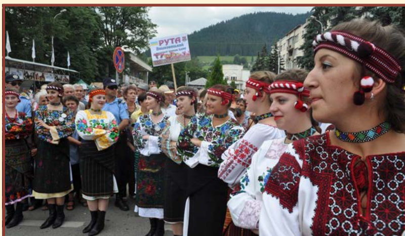
Zespół „Ruta” - Waszkowce - Ukraina