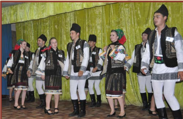
Zespół „Clopoțelul” - Comănești - Rumunia