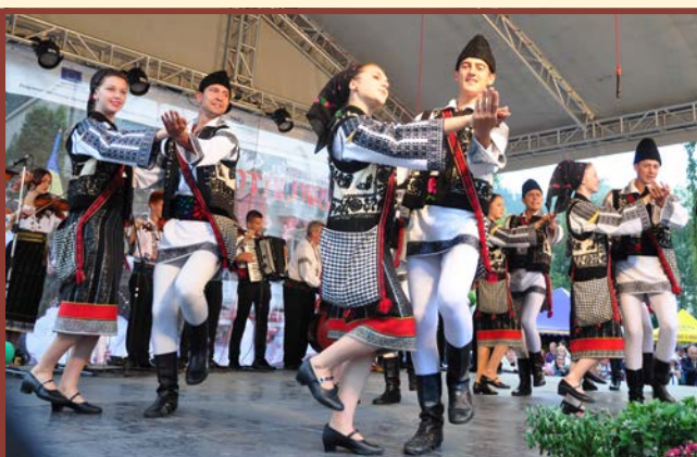
Zespół „Florile Bucovinei” - Rădăuți - Rumunia