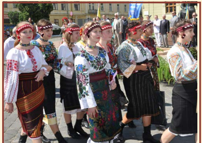
Zespół „Ruta” - Waszkowce - Ukraina

Nasz pobyt na festiwalu – mimo że był trochę krótki, był dla nas wszystkich okazją do zapoznania się z osiągnięciami artystycznymi zespołów bukowińskich, a także urzeczony zostaliśmy urokiem tego pięknego miasta. Mogliśmy również doświadczyć serdeczności od mieszkańców Czerniowiec. Poza tym wynieśliśmy niezapomniane bardzo miłe wrażenia z występów na estradzie Festiwalu „Bukowińskie Spotkania”.