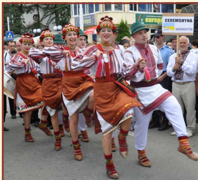
Zespół „Ceremshyna” - Waszkowce - Ukraina

soțit plăcuta atmosferă, dar în ciuda ploii și chiar a furtunii și grindinei numeroși locuitori veneau și se