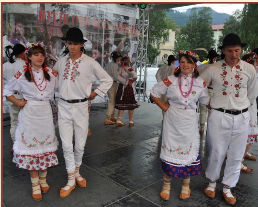
Zespół „Mała Pojana” - Pojana Mikuli - Rumunia

Stał się on możliwością do odwiedzenia grobów swoich przodków, spotkania się z rodzinami oraz nawiązania nowych znajomości, które bardzo często przerażają się w długotrwałe przyjaźnie. Gościnność, dobroć i przychylność mieszkańców Pojany Mikuli znana jest nie od dziś. Już pierwszego dnia, w niedzielę 14 lipca, ksiądz proboszcz dla przybyłych Polaków odprawił dodatkową mszę św. w kościele bł. Jana Pawła II. Po mszy była okazja do powitań, rozmów i wspólnych zdjęć z księdzem i pojańskimi rodzinami. W drugim dniu pobytu w Rumunii cała grupa z Polski wraz z młodzieżą z Pojany Mikuli wyruszyła na wycieczkę krajoznawczą do Pleszy i Nowego Sołońca, polskich wsi na Bukowinie rumuńskiej, oraz Majdanu – wioski ukraińskiej. Pobyt w Pojanie Mikuli przebiegał w ciepłej, rodzinnej atmosferze, przy pięknej, słonecznej po-