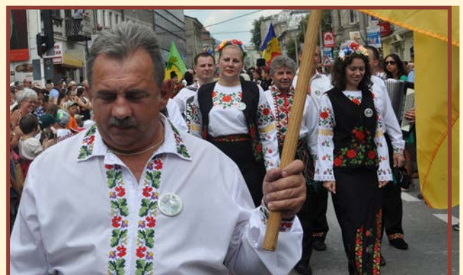
Zespół „Dzereło” - Czerniowce - Ukraina

aprints la apusul soarelui, au evidențiat importanța acestei întâlniri.