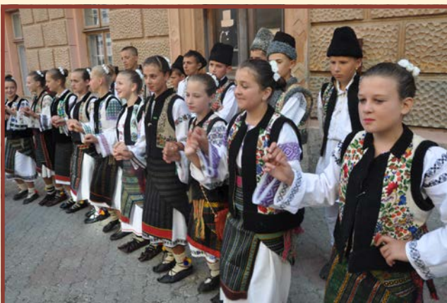
Zespół „Mugurel” - Pătrăuții de Jos - Ukraina

Bardzo dobrym rozwiązaniem na rozpoczęcie prezentacji było wykonanie przez każdy zespół jed-