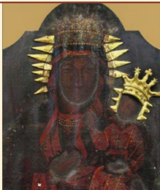
Zdjęcie obrazu Matki Bożej Kaczyckiej podczas restauracji

Una dintre cele mai vechi icoane ale Maicii Domnului de la Częstochowa este icoana Preasfintei Fecioare din Bochnia, pictată în secolul al XV-lea sau începutul secolului al XVI-lea. Există o ipoteză conform căreia pictura a fost făcută în Cracovia, în perioada când icoana de la Częstochowa se afla aici pentru restaurare în urma distrugerilor suferite după atacul husit asupra complexului paulin de la Jasna Góra din anul 1430. Timp de patru ani, o echipă de pictori, lucrând la restaurarea icoanei, ar fi pictat câteva exemplare, care mai târziu devenind miraculoase au trecut de la persoanele private la bisericile din jurul Cracoviei, printre care și la biserica din Bochnia.