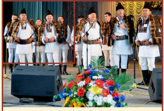
Zespół „Piatra Șoimului” - Câmpulung Moldovenesc - Rumunia