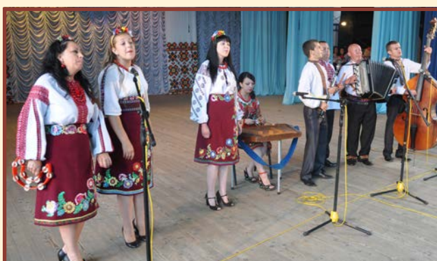
Zespół „Złota Krynica” - Czerniowce - Ukraina