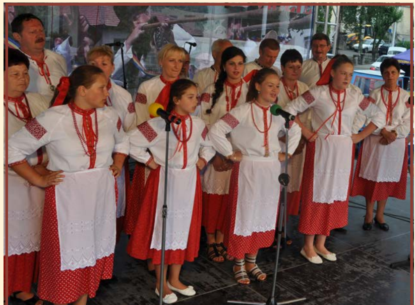
Zespół „Mikulanka” - Horna Stubna - Słowacja