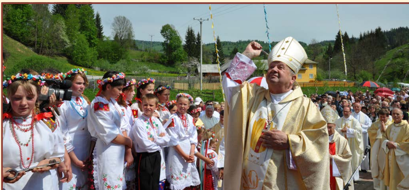
Kardynał Stanisław Dziwisz podczas konsekracji nowego Kościoła pw. Błogosławionego Jana Pawła II w Pojanie Mikuli