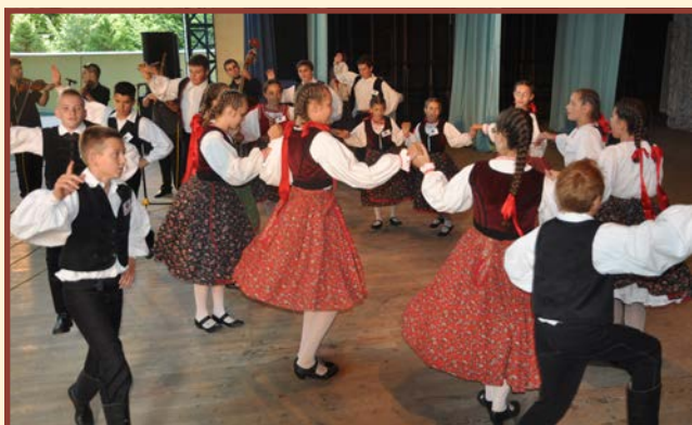
Völgység Néptánc Egyesület - Bonyhád - Węgry

Ansambblul muntenilor Czadca „Jodelki” a prezentat cântece și dansuri din folclorul muntenesc, care se armonizau cu interesantele lor costume populare primit cu căldură de public. Ansambblul nostru „Echo Bukowiny” a prezentat, în programul său, cântece cu tematică bucovineană, atât vechi („de ex. „Unde ești fată cu cosițe” sau cântecul românesc „A ruginit frunza din vii”), cât și mai noi (de ex. „Voi revedea iar Bucovina”). Toate piesele noastre se caracterizau prin nostalgie și dor după locurile natale și poate de aceea au fost primite cu ovații de către spectatorii prezenți precum și de către membrii ansamblurilor. Cântecele și dansurile de pe scena amfiteatrului au atras atenția publicului până la evoluția ultimului ansamblu la orele serii.