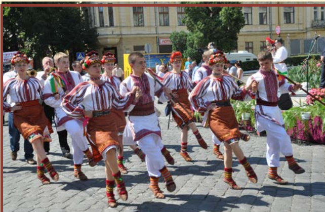
Zespół „Czeremszyna” - Waszkowce - Ukraina