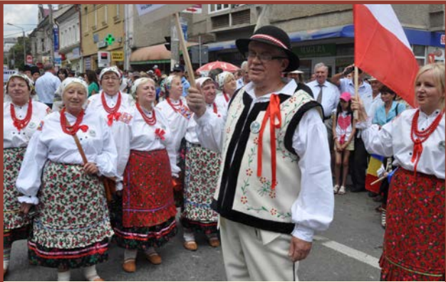
Zespół „Podgrodzianki” - Raciborowice Górne - Polska