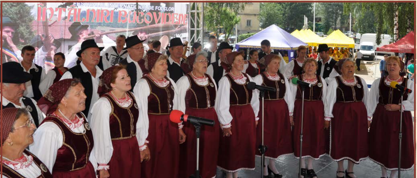
Magyar Dalkör Egzesület - Palotabozsok - Węgry

ze Słowacji, którego członkowie również wywodzą się z Pojany Mikuli. Nie mogło oczywiście zabraknąć zaprzyjaźnionego zespołu „Mała Pojana”, który był nie tylko gościem, ale przede wszystkim współorganizatorem jubileuszowej imprezy. Niecodzienne spotkanie kilku narodowościowych grup, któremu towarzyszyły wspólne bukowińskie śpiewy i tańce na zawsze pozostanie w pamięci. A dwie ogromne „watry”, czyli ogniska, które zapłonęły przy zachodzie słońca, podkreśliły rangę tego spotkania.