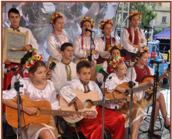
Zespół „Kolomeika” - Siret - Rumunia