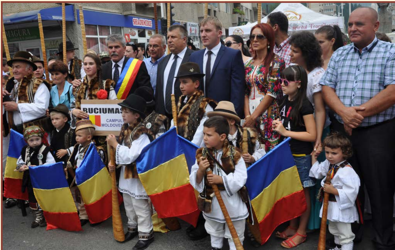
Oficiele wśród grupy „Buciumașii” podczas korowodu