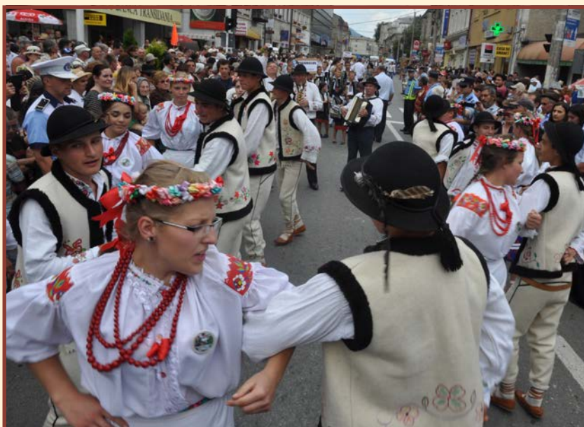
Zespół „Solonczanka” - Nowy Solonec - Rumunia

Przed oficjalnym otwarciem festiwalu ulicami miasta przeszedł barwny, wielonarodowościowy korowód. Mieszkańcy gromkimi brawami witali i podziwiali rozśpiewanych i roztańczonych uczestników tego przedsięwzięcia. Przez kolejne dni zespoły poprzez tańce i śpiewy regionalne prezentowały na scenie swoją kulturę i tradycję. Przez dłuższy okres słońce wtórowało przemiłej atmosferze, a pomimo deszczu, a nawet burzy i gradu, mieszkańcy w dużej liczbie przycho-