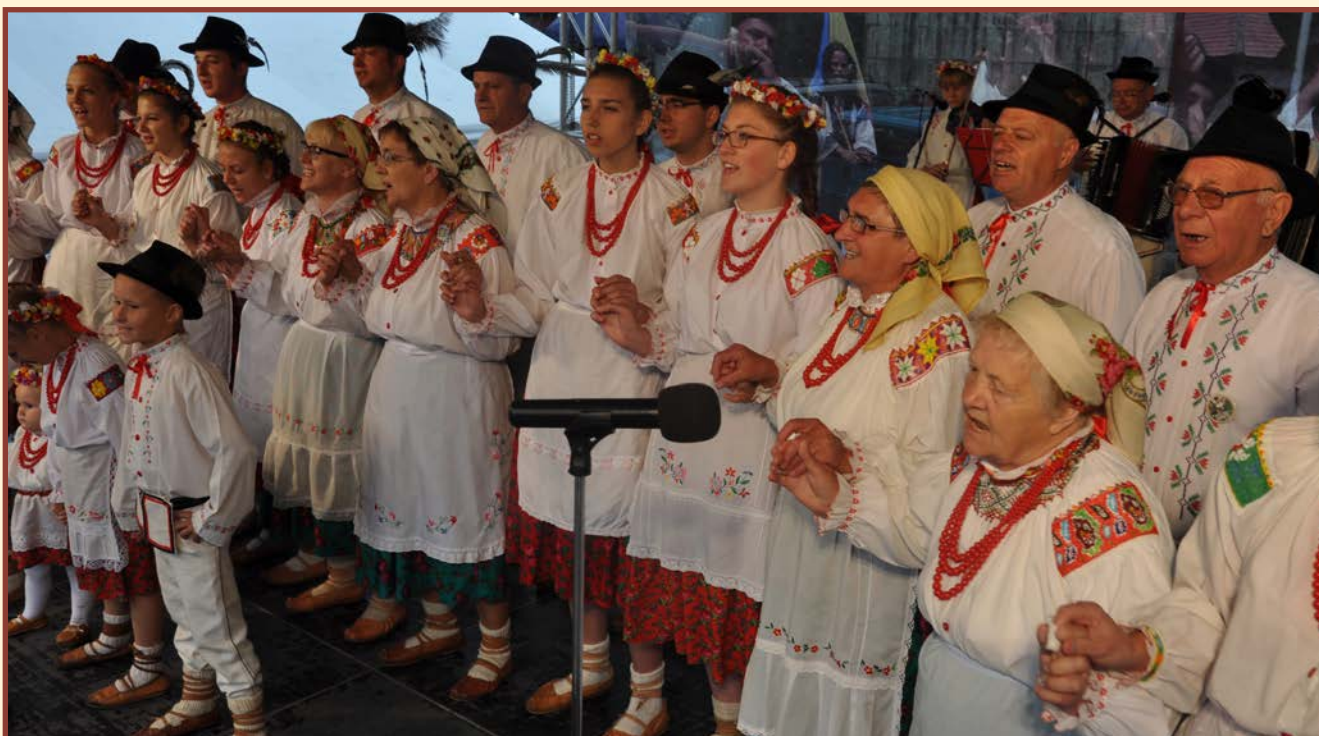
Zespół „Pojana” - Piława Dolna - Polska