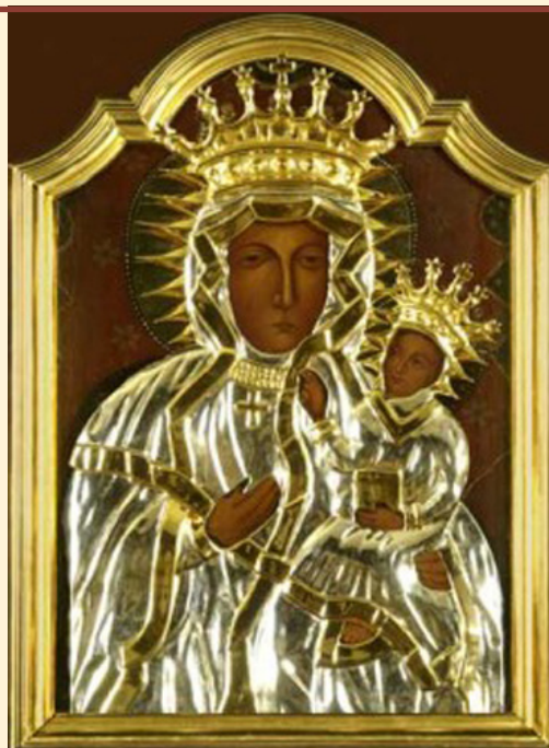
Zdjęcie obraz Matki Bożej Kaczyckiej podczas peregrynacji

Cultul icoanei de la Jasna Góra s-a răspândit și mai mult după respingerea asediului suedez de