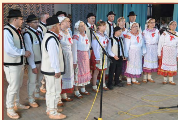
Zespół „Jodelki” - Żagań - Polska

Przy tej okazji członkowie Zespołu „Echo Bukowiny” składają serdeczne podziękowanie władzom miasta Czerniowce za zaproszenie na ten festiwal, za przyjęcie i okazaną nam gościnność.