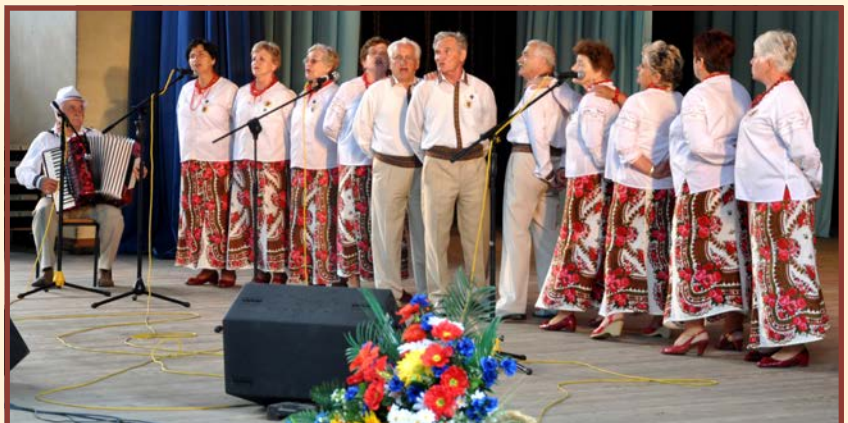
Zespół „Echo Bukowiny” - Lubań - Polska

În Piața Teatrului a avut loc deschiderea Târgului Petrivski, manifestare anuală în cadrul căruia au avut