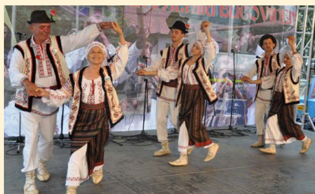
Specjalny gość – zespół „Rotunda” - Mołdawia