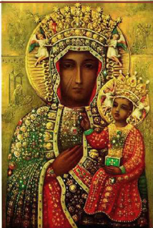
Zdjęcie obrazu Matki Bożej Częstochowskiej

Obraz bocheński znajdował się początkowo w klasztorze Dominikanów, po kasacie klasztoru w 1777 r. obraz przeniesiono do kościoła parafialnego. Czczono go pod wezwaniem Matki Boskiej Różańcowej, a w księdze cudów od 1742 r. spisywano wyproszone za wstawiennictwem Maryi liczne łaski. Najbardziej znaną formą kultu był odpust na Matkę Bożą Różańcową, obchodzony w drugą niedzielę października.