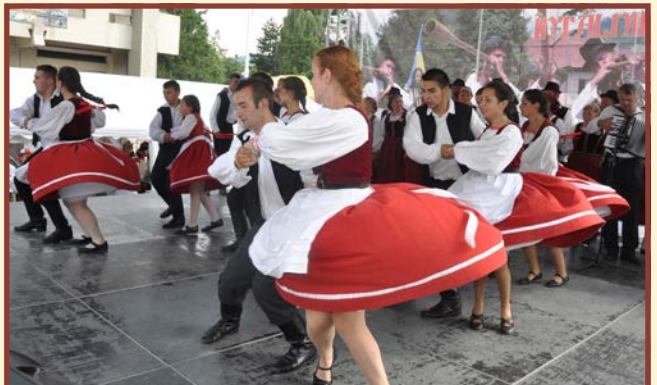
Ansamblul folcloric de tradiții al secuilor bucovineni - Cristur - Rumunia

godzie. Jednak głównym punktem wizyty w rodzinnej wiosce było świętowanie tam jubileuszu 55-lecia powstania czteropokoleniowego zespołu „Pojana” z Piławy Dolnej. Przepyszne „mici”, gołąbki, pieczona baranina, różnorakie ciasta oraz inne potrawy królowały na stołach. Nie zabrakło oczywiście swojskich pojańskich nalewek. Wspaniałą atmosferę pomogły stworzyć zaproszone na tę uroczystość zespoły: Kapela „Syrba” z Polski oraz Zespół Śpiewaczy „Mikulanka”