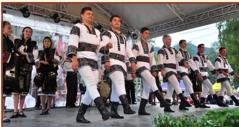
Zespół „Plaiurile Solonețului” - Todirești - Rumunia

dzili i cieszyli swoją obecnością do ostatniego dnia festiwalu, co sprawiało jego uczestnikom podwójną radość.