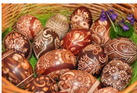
Pisanki polskie Autorka: Katarzyna Smykla – artystka-plastyk