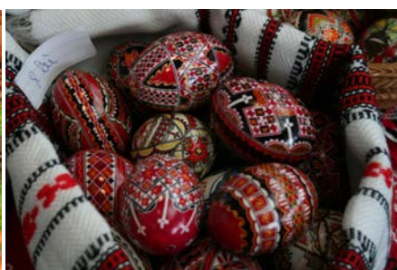
Tradycyjne bukowińskie pisanki Autorka: Nicoleta Pușcaș – artystka-plastyk

T radițiile și obiceiurile muntenilor polonezi veniți pe meleagurile Bucovinei în urmă cu 180 de ani și moștenite de la înaintași transmise din generație în generație sunt păstrate cu sfințenie până astăzi în Solonețu Nou – enclavă a spiritului polonez. Aceste tradiții și obiceiuri sunt legate, mai ales, de marile sărbători religioase – Nașterea și Învierea Domnului.