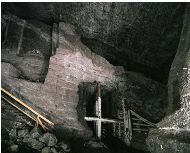
Kopalnia Soli Wieliczka – komora Margielnik

Tyle legenda. Faktem jest, że Kopalnia Soli w Wieliczce to najstarsze na ziemiach polskich oraz jed-