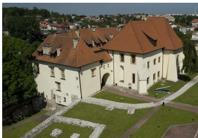
Zamek Żupny w Wieliczce

în stăpânire împreună cu soțul său, regele Bolesław cel Rușinos. În puțul de mină pe care l-a primit a aruncat un inel de aur și apoi, când era deja în Polonia, a poruncit să se sape puțuri de sare în regiunea Wieliczka. În primul bulgăre de halit care a fost extras, se afla inelul aruncat de ea.