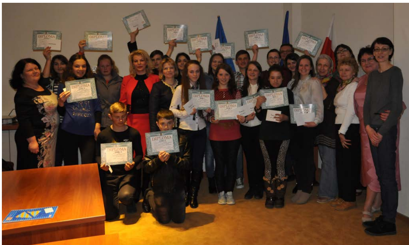
Wszyscy uczestnicy olimpiady krajowej

w Bukareszcie. Laureaci międzynarodowej olimpiady w Warszawie – wstęp na polonistykę na Uniwersytecie Warszawskim. „Chcę podkreślić – powiedziała podczas otwarcia Elvira Codrea – fakt, że wszyscy uczestnicy są zwycięzcami, niezależnie od zdobytych nagród, ponieważ sam powód do udziału w olimpiadzie to poczucie przynależności do polskiej mniejszości, miłość do języka, literatury i kultury narodu polskiego”. I dodała także rzecz bardzo ważną: „Nie możemy zapominać i zaniedbywać tego, że języka ojczystego nie dziedziczy się automatycznie, trzeba się go uczyć, kochać go i wzbogacać systematycznie, dlatego że język ojczysty jest największym skarbem każdego człowieka”.