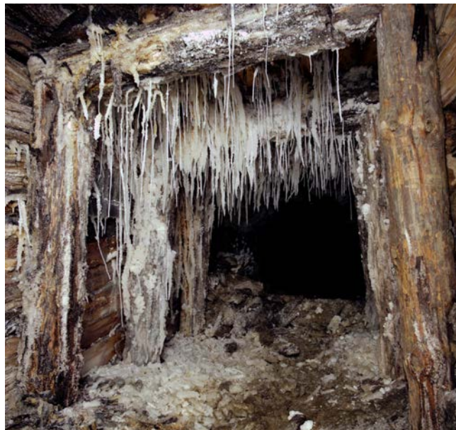
Wyciek solanki w starym chodniku bocheńskiej kopalni

Fiecare rege din Polonia, preluând puterea în țară, considera că datoria lui de gospodar îl obliga să fie prezent la Wieliczka. În timpul împărțirii Poloniei, locul acesta a fost vizitat de țarul Alexandru și de împărăția austriei.