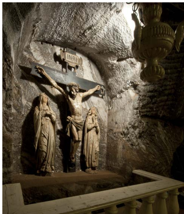
Pieta w Kaplicy św. Kingi w Kopalni Soli Bochnia

Splendide capele, fermecătoare lacuri subterane, echipamente și utilaje originale, urmele păstrate ale muncii minerilor dau o imagine a luptei oamenilor cu stihia, munca lor, pasiunile, credința. Minerii din