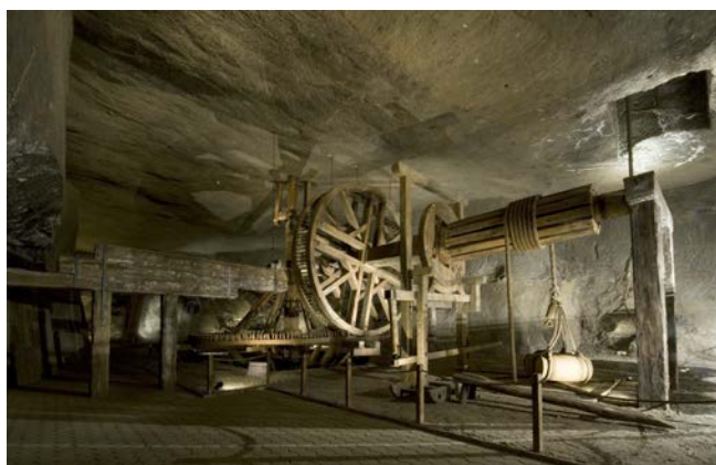
Kierat polski w ekspozycji Muzeum Żup Krakowskich