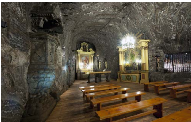
Kaplica św. Kingi w Kopalni Soli Bochnia

no z najstarszych na terenach Europy przedsiębiorstwo zajmujące się wydobywaniem oraz produkcją soli, którego początki sięgają XIII w. Przez całe wieki była źródłem bogactwa kraju i materialnym śladem kultury.