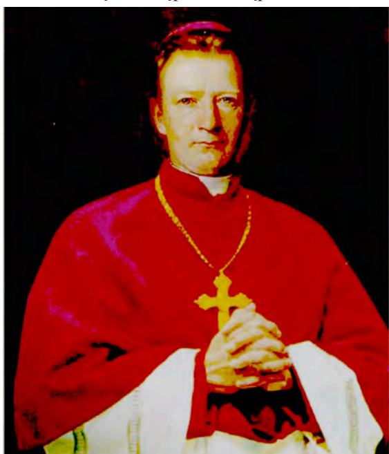
św. Józef Bilczewski

Józef Bilczewski urodził się 26 kwietnia 1860 r. w Wilamowicach. Po ukończeniu szkoły ludowej w Wilamowicach i Kętach uczęszczał do gimnazjum w Wadowicach, w którym w 1880 r. zdał z odznaczeniem maturę. Następnie wstąpił do seminarium