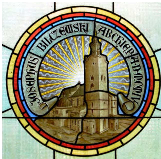
Witraż w sanktuarium w Kaczyce poświęcony abp. Bilczewskiemu

Po swoim powrocie do Lwowa arcybiskup odnotował: „Niemcom żadna się nie dzieje krzywda