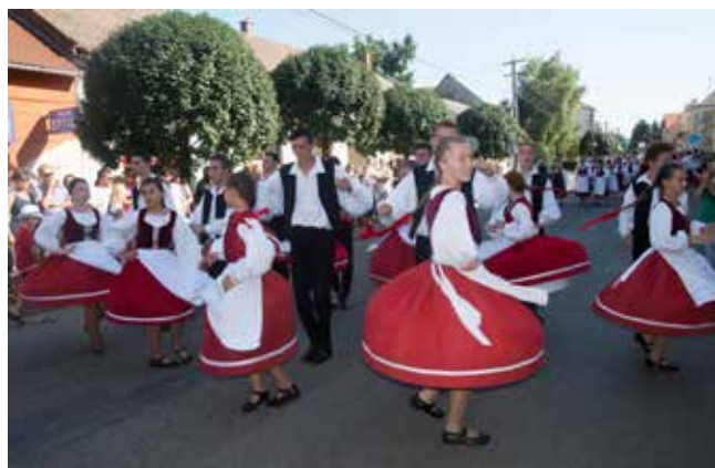
Szeklerski zespół – Cristur, Rumunia

componentă redusă. În afara unui număr mare de grupe ale secuilor din Ungaria, au evoluat două ansambluri din Polonia: „Podgrodzianki” din Raciborowice Górne și „Pojana” din Piława Dolna. România a fost reprezentată de un ansamblu bucovinean „Florile Bucovinei” și trei grupe secuiești. Ucraina a fost reprezentată de ansamblul „Cernivceanca” din Cernăuți. Au lipsit R. Moldova și Serbia.