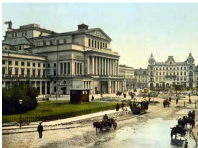
Teatr Wielki w Warszawie (ok. 1890)