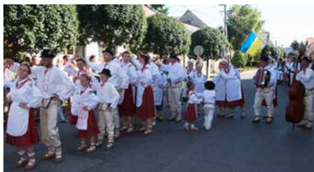
„Pojana”– Piława Dolna, Polska