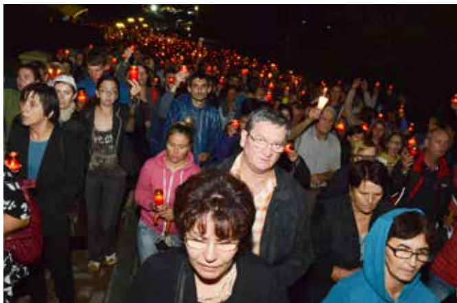
Nocna procesja ze świecami wokół Sanktuarium