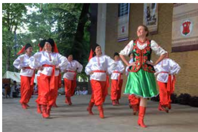
„Czerniwczanka”– Czerniowce, Ukraina

Następnie przyszedł czas na długo już wyczekiwane prezentacje poszczególnych zespołów.