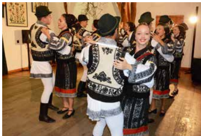
„Florile Bucovinei” – Rădăuți, Rumunia

Ediția secuilor a început pe data de 31 iulie 2015 și a luat sfârșit pe data de 3 august 2015. Ultima zi din iulie a fost consacrată ședinței organizatorice cu conducătorii ansamblurilor. Însă deschiderea oficială a avut loc în ziua următoare. Tradițional, festivalul a fost inaugurat de parada costumelor colorate în fruntea cărora s-au aflat călăreții îmbrăcați în tradiționalele costume ale cavaleriei ungare. Apoi au urmat evoluțiile ansamblurilor prezente, de mult timp așteptate.