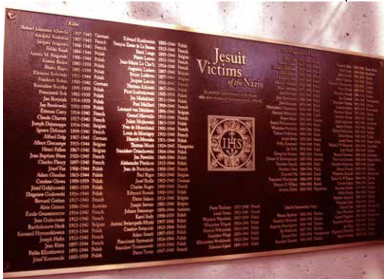
„Biała Księga. Martyrologium duchowieństwa polskiego XX wieku”

Având în vedere capacitățile sale științifice, conducerea Ordinului l-a