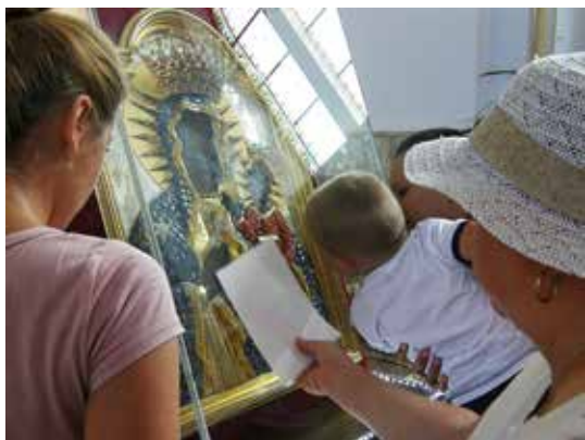
Pielgrzymi oddają hołd cudownemu wizerunkowi Matki Bożej Kaczyckiej