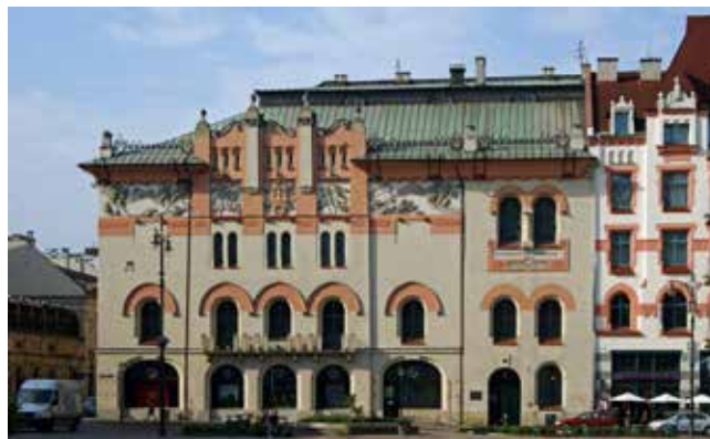
Narodowy Stary Teatr im. Heleny Modrzejewskiej w Krakowie

funcționează până azi la Varșovia, dar înainte de toate este sărbătoarea teatrului public, precum și expresia aprecierii pentru patrimoniul artiștilor și participarea lor la formarea atitudinii cetățenești și patrionikteatralnyotice. Sărbătorirea jubileului reiese, de asemenea, din convingerea că teatrul public, mai ales într-un stat democratic, este spațiul disputelor, instrumentul gândirii critice, precum și locul descoperirii și prezenței rezolvărilor inovatoare.