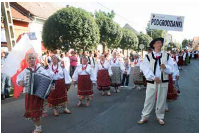
„Podgrodzianki” – Raciborowice Górne, Polska

Szeklerska edycja rozpoczęła się 31 lipca 2015 r. i potrwiała aż do 3 sierpnia. Ostatni dzień lipca poświęcono na posiedzenie organizacyjne z szefami zespołów. Natomiast uroczyste rozpoczęcie festiwalu przypadło na dzień następnny. Tradycyjnie już całość zainaugurował pochód barwnego korowodu, który poprowadzili konni w typowych węgierskich strojach.