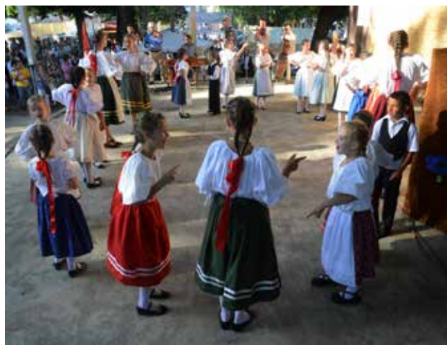
Dziecięcy zespół z Bonyhádu, Węgry

Festivalul s-a încheiat noaptea târziu printr-o seară dansantă integratoare. Toți instrumentiști împreună au cântat dansatorilor spontani din audiență.