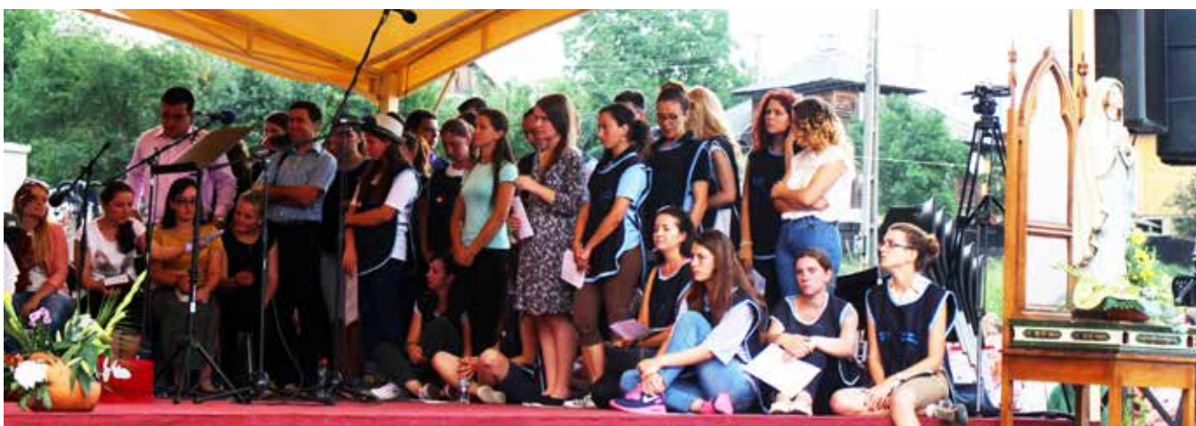
Chór młodzięży śpiewa podczas Mszy Św. odprawionej w jej intencji

La ora 16.00 s-a celebrat Calea Sfintei Cruci în jurul sanctuarului, care a fost condusă de tinerii voluntari. Liturghia de seară celebrată de E.S. Aurel