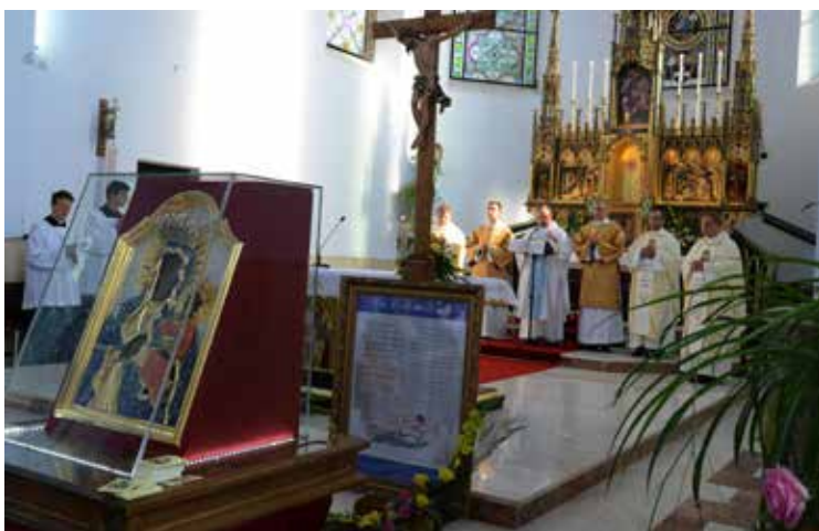
Msza Św. w języku polskim

Printre altele, în limba polonă la ora 9.15 care a fost concelebrată de preoții veniți din Polonia și preoții polonezi din Bucovina.