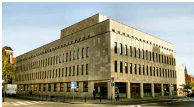
Teatr Wybrzeże – Gdańsk

19 listopada 2015 r. będziemy obchodzić 250. rocznicę pierwszego przedstawienia wystawionego przez polski zespół aktorski z inicjatywy króla Stanisława Augusta Poniatowskiego. Trupa ta stała się załącznikiem najstarszego stałego, zawodowego, publicznego teatru polskiego, który później przyjął nazwę Teatr Narodowy. Jubileusz ten to nie tylko okazja do przypomnienia rocznicy powołania działającej do dziś w Warszawie najważniejszej polskiej sceny, ale przede wszystkim święto teatru publicznego, a także wyraz uznania dla dorobku artystów i ich udziału