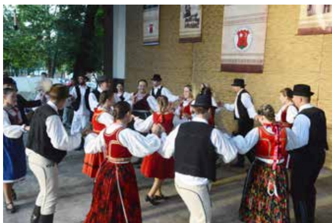
„Bokreta”– Högyász , Węgry