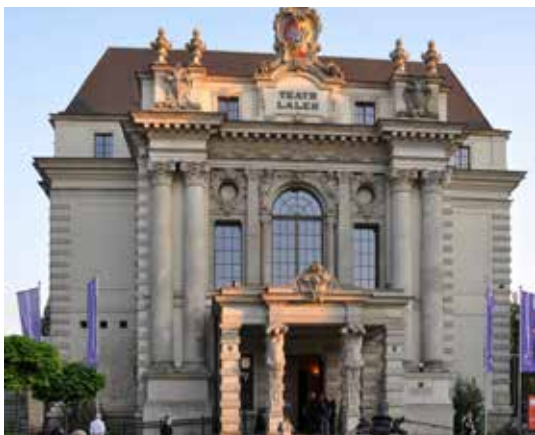
Wrocławski Teatr Lalek