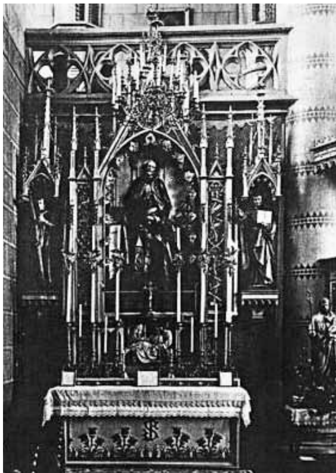
Boczny ołtarz kościoła jezuickiego w Czerniowcach