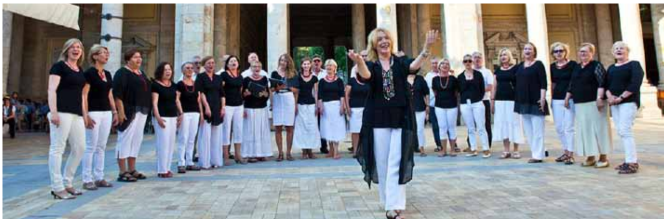
Występ na festiwalu Montecatini w 2015 r.