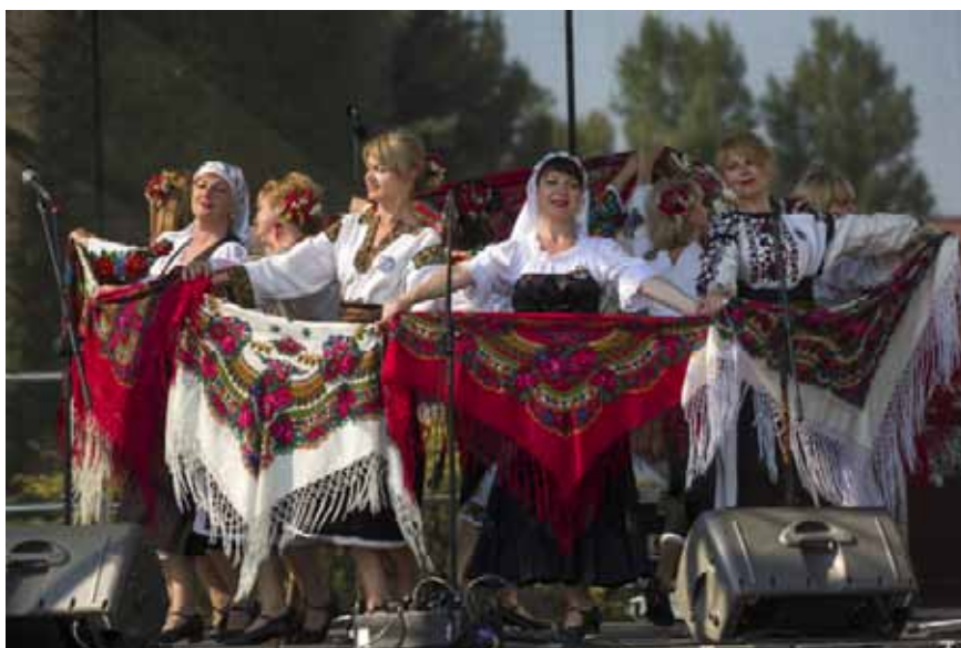
Czerniwczanka – Czerniowce – Ukraina

W piątek 24 czerwca, w dzień św. Jana, upał sięgnął 35 stopni. Na szczęście o 21:00 – kiedy na jastrowieckiej plaży rozpoczęło się widowisko, było już trochę chłodniej. W nastroj świętojańskiej nocy wprawił wszystkich koncert na scenie ustawionej nad brzegiem jeziora. Na tle ciemniejącego nieba i wody zespoły prezentowały się wspaniale. Gdy zapadł zmierzch, na scenie pojawiły się „Czerniwczanki” w białych sukienkach i wiankami