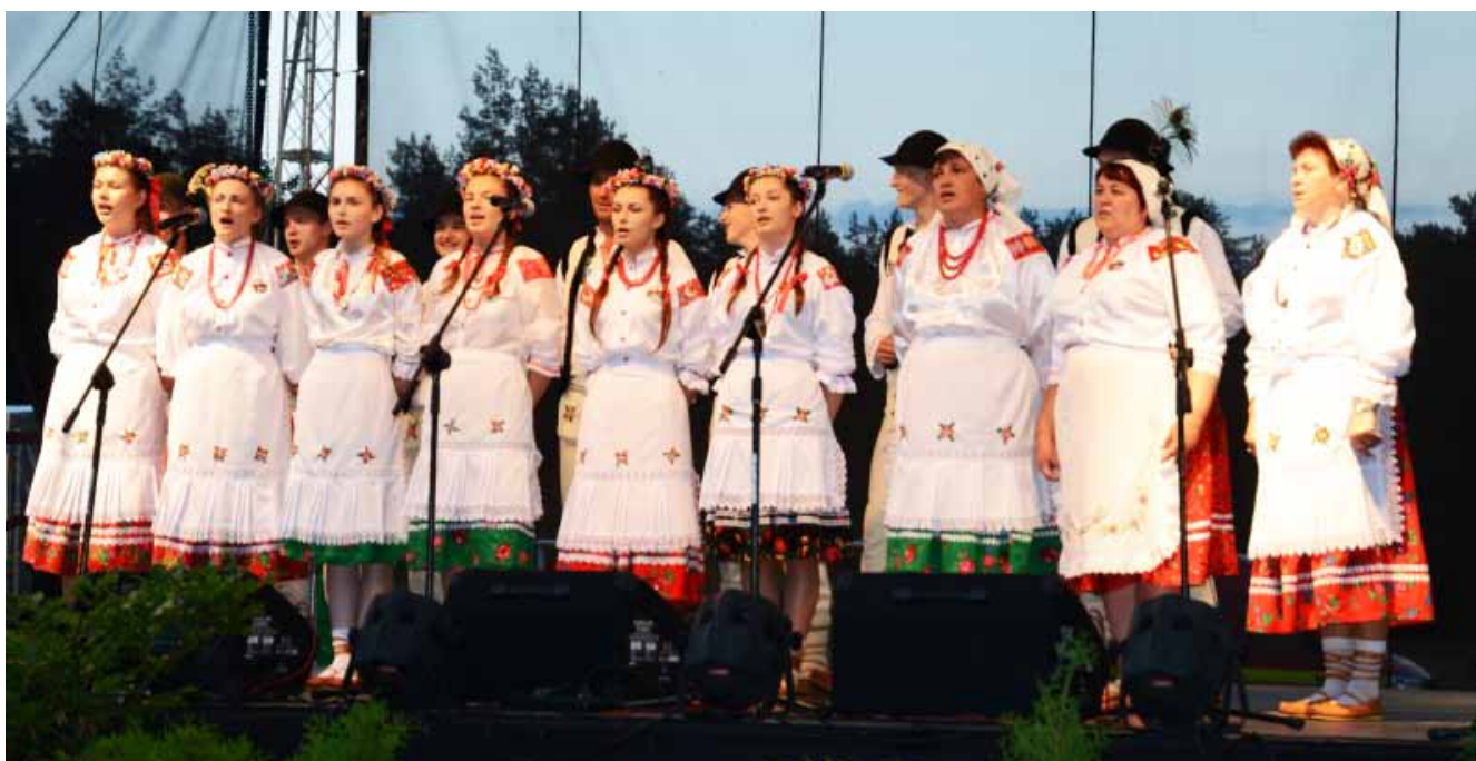
Mała Pojana – Pojana Mikuli – Rumunia