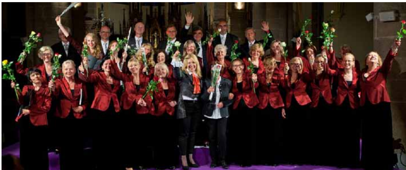
Collegium Baccalarum w Bretanii w 2014 r.