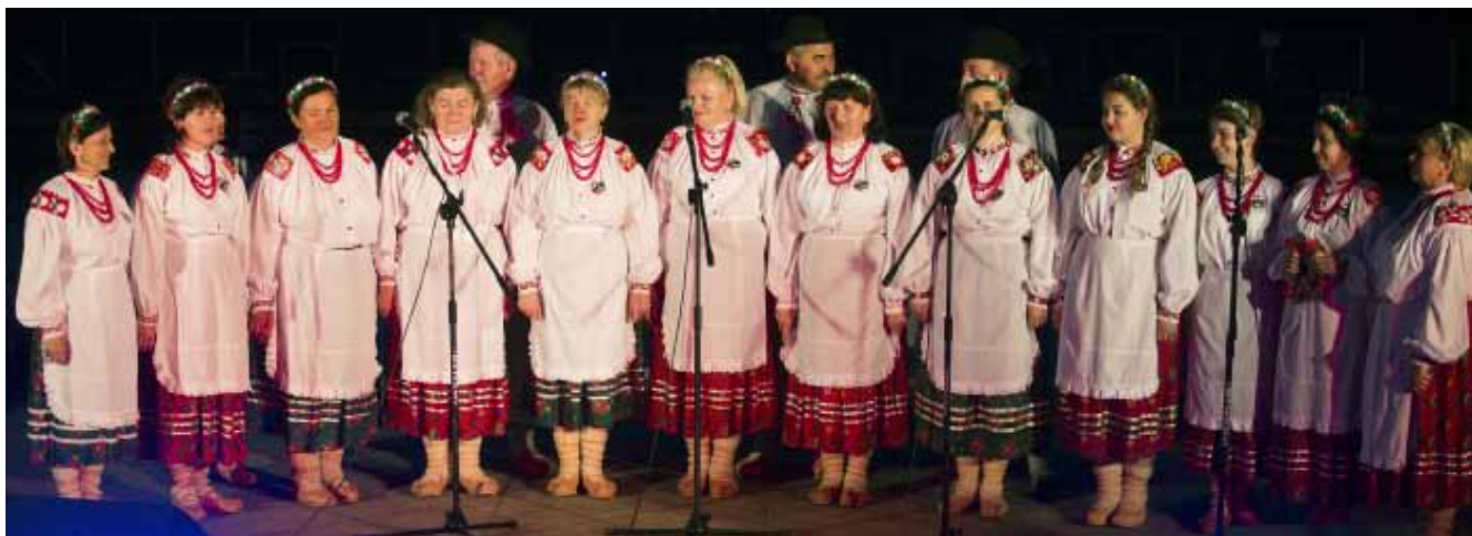
Wianeczek – Dolne Piotrowce – Ukraina