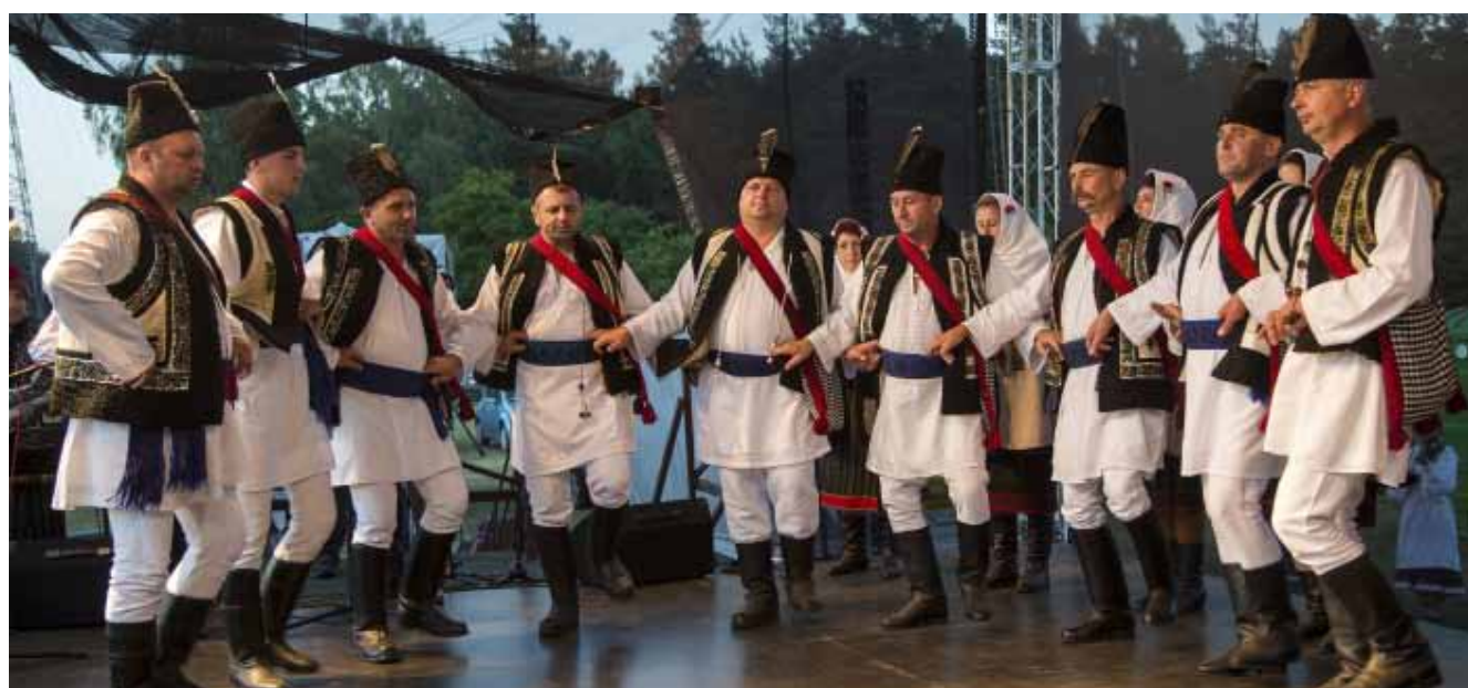
Arcanul Bătrânesc – Frătăuții Noi – Rumunia

się to dobrym pomysłem, bo publiczności było więcej niż w poprzednim roku.