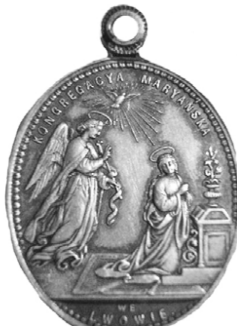
Medalik Sodalicji Mariańskiej we Lwowie