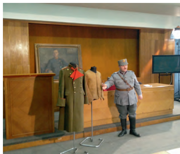
Muzeul Național Militar – tunica cu urma glonțului care l-a rănit pe gen. Cihoski Wojskowe Muzeum Narodowe – bluza ze śladem po kuli, która zraniła gen. Cihoskiego

România a devenit a doua patrie a familiei Cihoski care a transmis copiilor idealurile luptei pentru libertate, cultul onoarei și sentimentul datoriei față de patrie. Micul Henri s-a născut pe pământ românesc, iar valorile primite în familie le-a dăruit noii patrii care le-a oferit adăpost în acele timpuri grele pentru poporul polonez. De aici vocația datoriei față de poporul român. Astfel în mod simbolic, așa cum tatăl și-a adus aportul la Mica Unire din 1859 și fiul a ales să meargă pe urmele lui, luptând sub tricolorul românesc pentru Marea Unire din 1918.