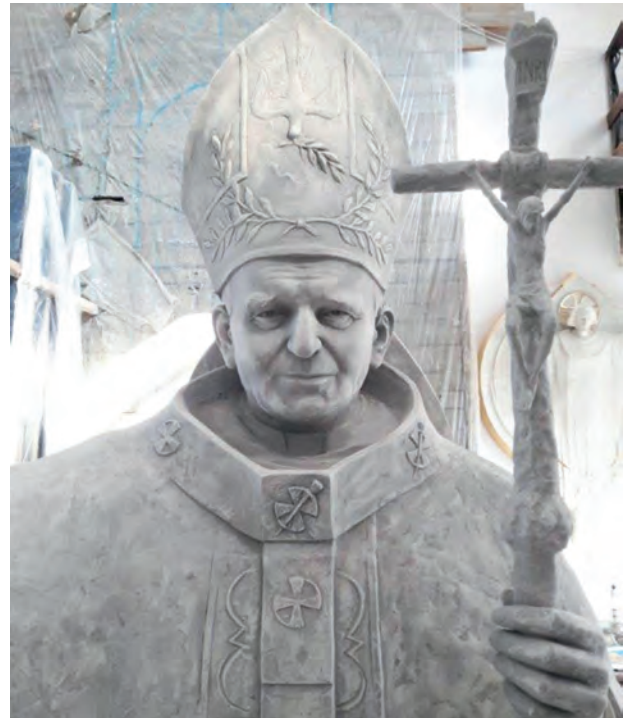
Pomnik św. Jana Pawła II w pracowni artysty Monumentul Sfântului Ioan Paul al II-lea în atelierul artistului

mi-a zâmbit în strofele poemelor cu bucuria păsării care nu ară dar cântă croindu-și dragoste rară