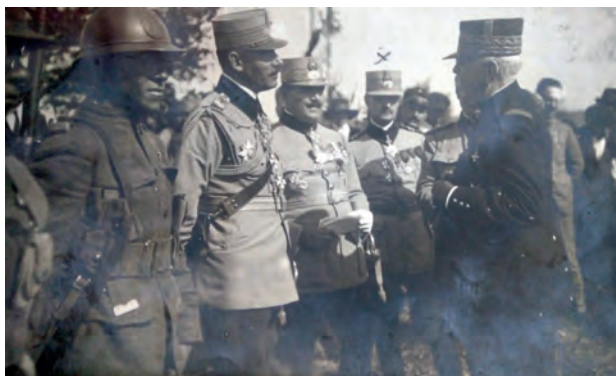
Z marszałkiem Francji Josephem Joffre (trzeci oficer z lewej)